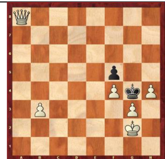
Zadanie 93 1X