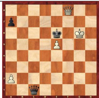
Zadanie 90 1X