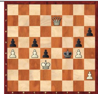
Zadanie 91 1X