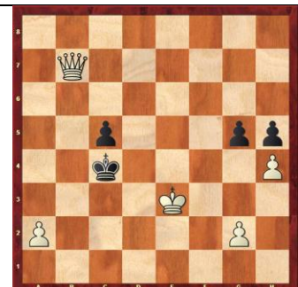
Zadanie 95 1X