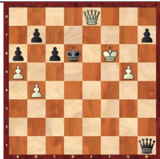
Zadanie 92 1X