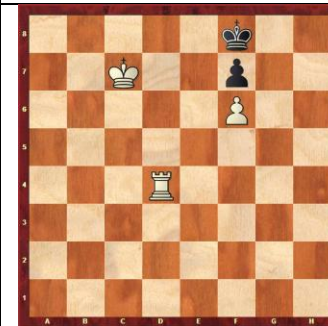
Zadanie 68 1X