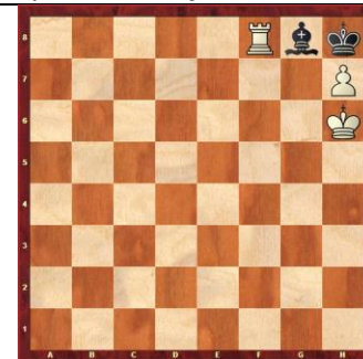
Zadanie 65 1X