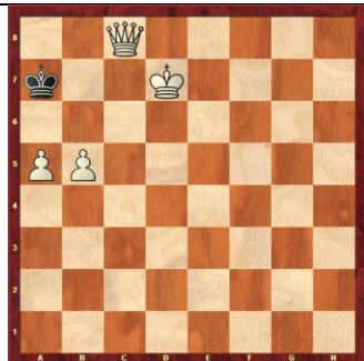
Zadanie 94 1X