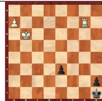
Zadanie 69 1X