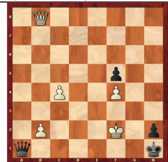
Zadanie 89 1X