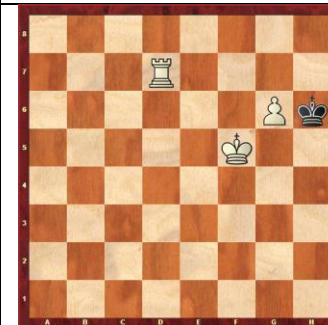
Zadanie 70 1X

Zadanie 65 1 rozwiązanie - 1.Wf8:g8X 2 rozwiązanie - 1.h7:g8WX 3 rozwiązanie - 1.h7:g8HX