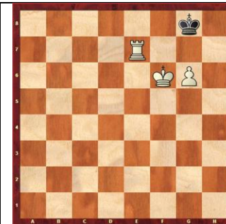
Zadanie 66 1X

Zadanie 69 1 rozwiązanie - 1.a7-a8HX 2 rozwiązanie - 1.a7-a8GX