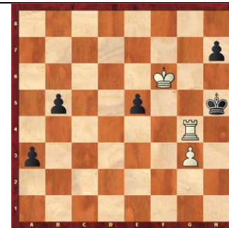
Zadanie 67 1X