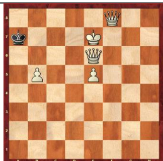
Zadanie 96 1X